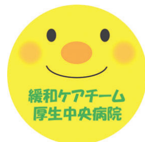
当院の緩和ケア診療加算件数

当院で診療を受けている患者様、ご家族からのご相談、近隣でご活躍される医療従事者、介護者様からのご相談もお受けいたします。