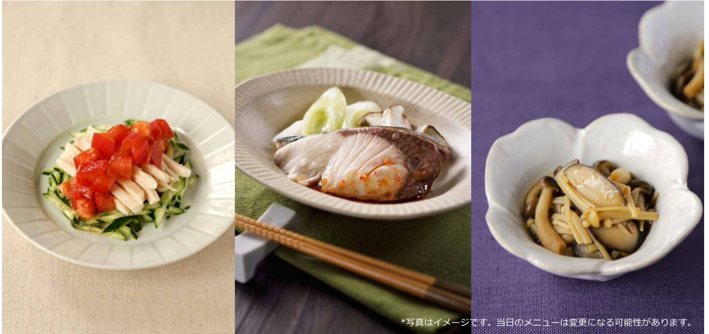
*写真はイメージです。当日のメニューは変更になる可能性があります。